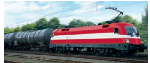
Solar-Wechselrichter von SMA und Eisenbahntransport der VTG AG

■ NACHHALTIGKEIT: Der Fonds investiert nur in Branchen, die sich durch einen schonenden Umgang mit natürlichen Ressourcen oder durch einen „Beitrag zur gesellschaftlichen Entwicklung“ auszeichnen. Alle Aktien stammen aus nachhaltigen Bereichen wie Umwelttechnik, ökologisches Bauen, Gesundheit und nachhaltiger Verkehr. Es gelten viele Ausschlusskriterien, alle ohne Toleranzschwelle. Tabu sind Aktivitäten wie Tierversuche, Gentechnik, Geschäfte mit Mineralöl. Unsere Überprüfung der 33 Aktien des Fonds (Halbjahresbericht 2016) ergab keinen Verstoß gegen die Ausschlusskriterien. Der Fonds investiert z.B. in die VTG AG, die Eisenbahnwaggons vermietet, in den Biolebensmittel-Händler Wessanen, in Erneuerbare-Energie-Aktien wie Nordex und SMA Solar Technology AG, in den Hörgerätehersteller Sonova und den Brillenanbieter Fielmann AG. Der Fonds ist ein Aktienfonds, rund 13 Prozent des Kapitals sind aber in Direktbeteiligungen investiert. Der Fonds stellte damit Kapital vor allem für Windkraft-, Solar- und Geothermieprojekte zur Verfügung. Hauseigenes Nachhaltigkeitsresearch, das auch Engagement-Aufgaben übernimmt. Ein Anlageausschuss mit unabhängigen Experten überprüft die Aktienausswahl.