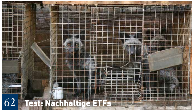
62 Test: Nachhaltige ETFs