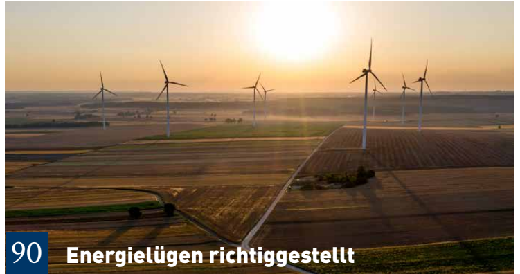
90 Energielügen richtiggestellt