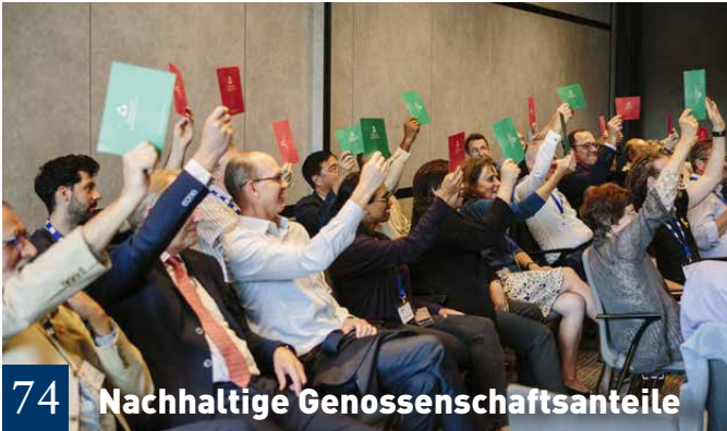
74 Nachhaltige Genossenschaftsanteile