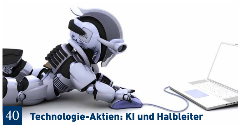
40 Technologie-Aktien: KI und Halbleiter