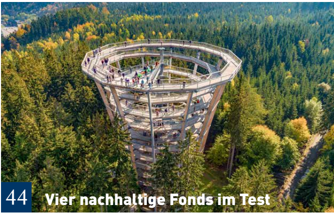
44 Vier nachhaltige Fonds im Test