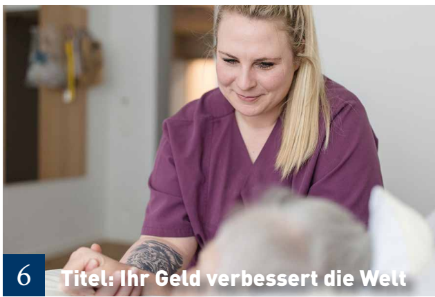
6 Titel: Ihr Geld verbessert die Welt