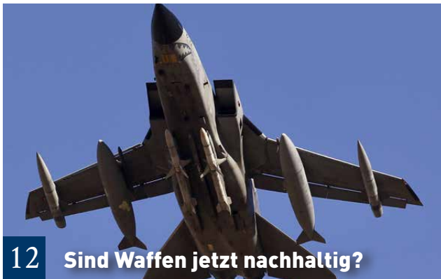
12 Sind Waffen jetzt nachhaltig?