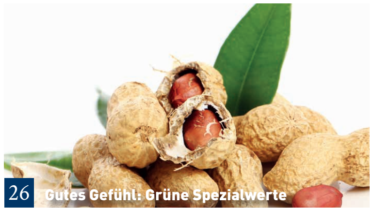
26 Gutes Gefühl: Grüne Spezialwerte