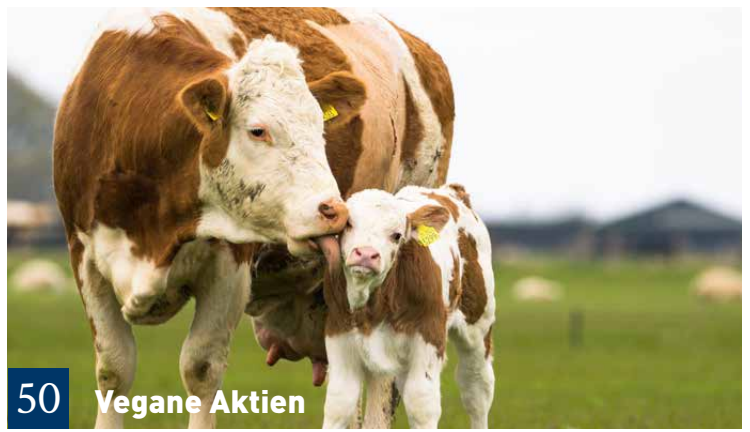
50 Vegane Aktien