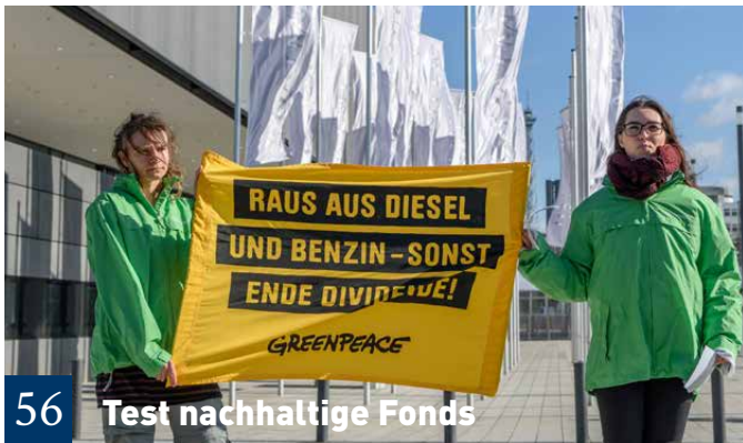
56 Test nachhaltige Fonds