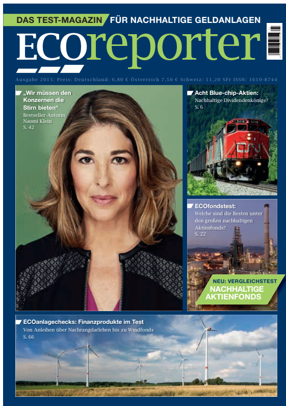
Titelseite ECOreporter-Magazin: In der im Juni 2015 erschienenen Ausgabe hat die ECOreporter-Testredaktion acht große nachhaltige Aktienfonds einem Vergleich unterzogen - finanziell und in Bezug auf Nachhaltigkeit.