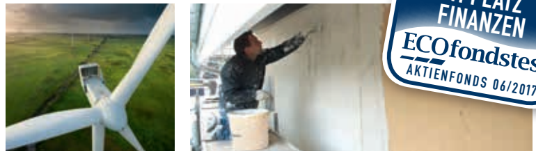
Windrad von Vestas und Dämmstoff von Steico im Einsatz

■ EMPFOHLENE ANLAGEDAUER: Ab drei Jahre, besser: fünf Jahre.