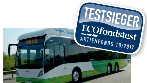
Bio-Produkte von Hain-Celestial, Bus mit Brennstoffzellenantrieb von Ballard Power: Auf beide Aktien setzt der Swisscanto-Fonds.

■ NACHHALTIGKEIT: Umfassender Nachhaltigkeitsansatz. Best-in-Class-Auswahl plus Ausschlusskriterien mit Null-Toleranz-Grenze. Zuerst liegt die Annahme, dass Unternehmen, die einen gesellschaftlichen Nutzen erbringen, überdurchschnittliche Wachstumsaussichten haben. Für den Fonds sind Atomkonzerne ebenso tabu wie Auto- und Flugzeugbauer, Betreiber von Flughäfen, Hersteller von PVC sowie Unternehmen, die nicht nachhaltige Geschäfte mit Waldwirtschaft und Fischfang machen. Die Ecoreporter.de-Überprüfung des Aktienportfolios ergab keinen Verstoß gegen die strengen Vorgaben des Fonds. Der Fonds hat etliche Umweltaktien, z.B. Ballard Power (Brennstoffzellen), Hain Celestial (Bio-Lebensmittel), init AG (IT für den ÖPNV), Solaredge (Solartechnik). Ferner anerkannte Best-in-Class-Konzerne wie Axa, Alphabet/Google, Geberit, jedoch auch den Finanzkonzern HSBC.