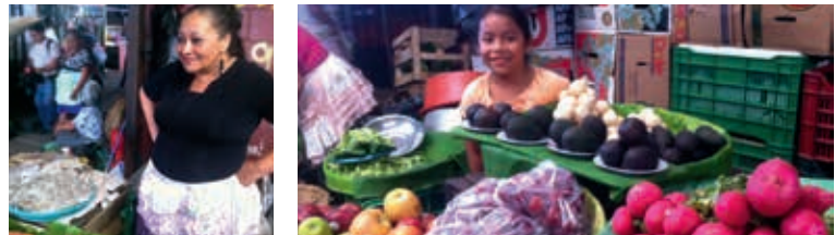
Mikrokreditkundinnen aus El Salvador. Der Dual Return Fund investiert stark in Lateinamerika.

■ EMPFOHLENE ANLAGEDAUER: Ab fünf Jahre, besser: sieben Jahre.