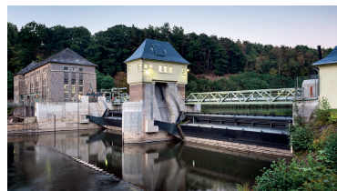
Unternehmen im Fonds: Ferrovie (Bahnbetreiber), Statkraft (u.a. Wasserkraftwerke)