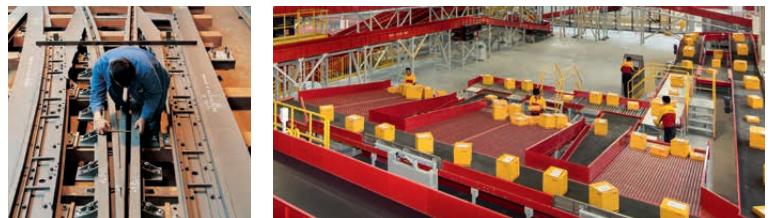
Schienensystem von Vossloh; Paketstraße der Deutsche Post AG.

■ EMPFOHLENE ANLAGEDAUER: Ab fünf Jahre, besser: sieben Jahre.