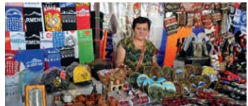
Mikrokreditkunden aus El Salvador und Armenien. In beiden Ländern ist der Dual Return Fund aktiv.

■ NACHHALTIGKEIT: Bei der Auswahl von Mikrofinanzinstituten folgt der Fonds Analysen des Beratungsunternehmens Symbiotics S.A. aus Genf. Es betreut seit 2004 Mikrofinanzinvestoren und prüft Mikrofinanzinstitute vor Ort. Regelmäßig begleitet das Fondsmanagement Symbiotics bei Prüfungen. Geprüft wird vor allem, wie qualifiziert Mikrofinanzinstitute Kunden beraten, ob sie Überschuldung wirkungsvoll vermeiden, ob sie neben Krediten andere Finanzdienstleistungen wie Ernteausschlagversicherungen anbieten und sich sozial engagieren, zum Beispiel Schulen unterstützen. Pluspunkte sammeln die Mikrofinanzinstitute, wenn sie bei der Kreditvergabe auch auf Umweltschutz achten, etwa Kredite für Wasseraufbereitung oder Erneuerbare Energie vergeben.