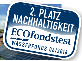
Reinheitsprobe beim Wasserkonzern Suez. Der Fonds investiert in Wasseraktien, aber auch in Solaraktien wie den Projektierer SolarCity.

■ WASSERSTAND: Der Fonds investiert in Unternehmen, die zum schonenden Umgang mit Wasser beitragen. Dabei gelten keine Mindestquoten für den Anteil der Wassergeschäfte am Gesamtumsatz. Ein Unternehmen kann sich für den Fonds auch dadurch qualifizieren, dass es engagiert den Verbrauch von Wasser verringert. Es muss aber in seiner Branche zu den Nachhaltigkeitsführern gehören. Dazu zählt ÖkoWorld etwa die chinesische CT Environmental. Sie ist darauf spezialisiert, die Abwasser aus Betrieben der Textilindustrie und aus Färbereien zu klären. Weitere Wasseraktien: z.B. der italienische Versorger ACEA, der Wasseraufbereiter Cantel Medical (USA). Der Fonds enthält etliche Erneuerbare-Energie-Aktien, etwa Terraform Power und SolarCity. Mit dem Argument, dass Kohle- und Atomkraftwerke extrem viel Wasser verbrauchen, Wind- und Solarparks aber nicht.